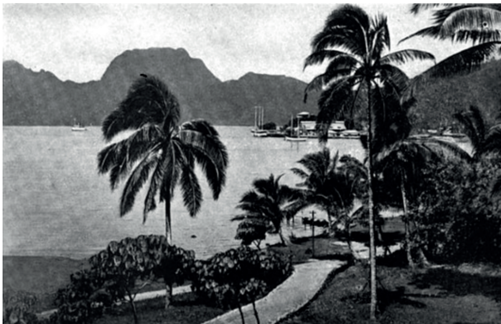
Estación Naval Samoa americana

El buque recaló a Río de Janeiro , cuando la influenza española ya estaba presente en esa ciudad. El contagio se había iniciado con el arribo del vapor Demerara el 17 de septiembre. Aun así, partidas de trabajo y la tripulación bajaron a tierra con toda libertad, mientras la pandemia se expandía por la ciudad. El día 7 de octubre los dos primeros casos de influenza se hacían presente a bordo. Las medidas en contra del contagio se iniciaron apresuradamente, fueron muy pocas y demasiado tarde, no