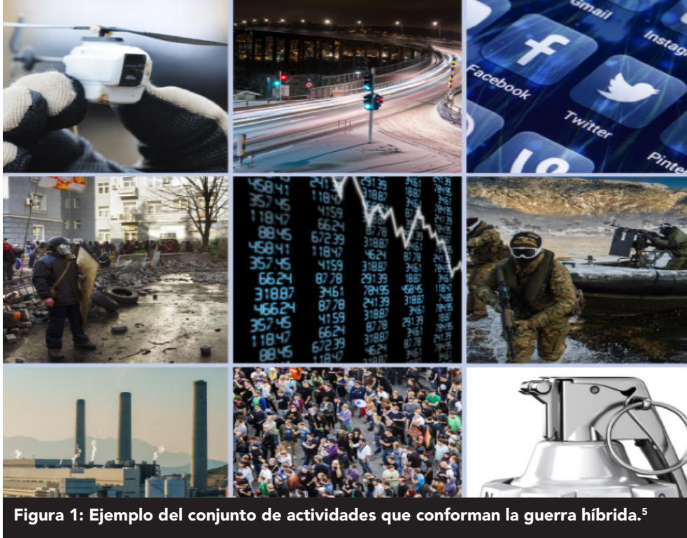
Figura 1: Ejemplo del conjunto de actividades que conforman la guerra híbrida. 5

académicos militares, para entenderla y perfeccionarla, se inició un esfuerzo por el estudio del fenómeno como una nueva forma de hacer la guerra, especialmente a contar de mediados del siglo XVIII, destacándose los postulados inferidos al respecto por personajes de gran relevancia histórica como Napoleón , Moltke y Clausewitz , siendo este último uno de los más destacados, cuyos escritos fueron publicados póstumamente el año 1827, bajo el título Vom Kriege , 3 los cuales han tenido gran influencia en el mundo militar, político y académico hasta nuestros días, especialmente por sus postulados sobre la naturaleza del fenómeno entre naciones.