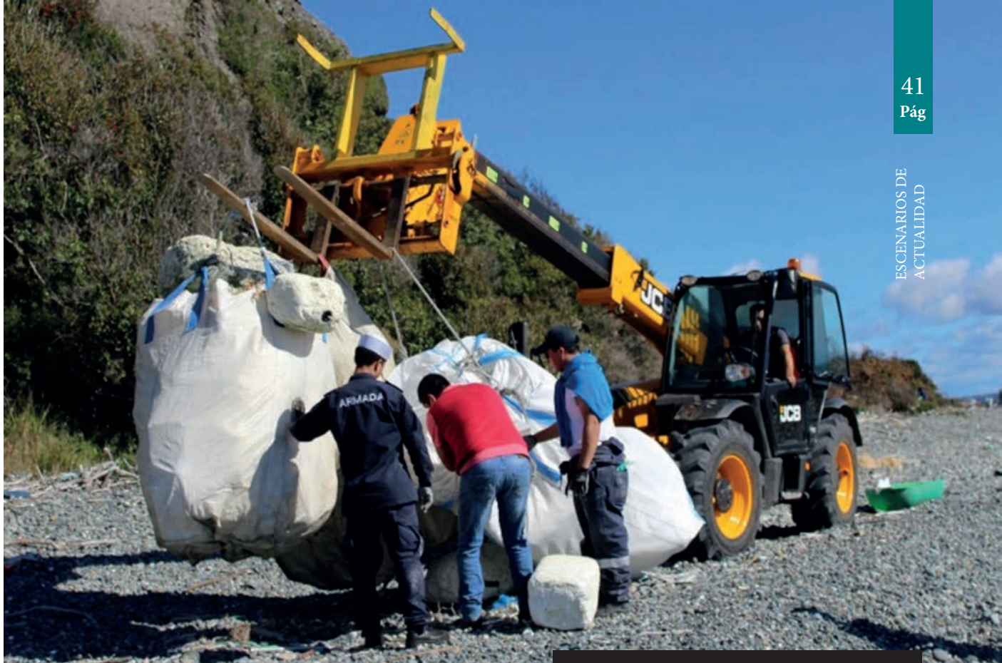
Figura 2. Limpieza de playas del área de Chiloé

la Armada (DGSA), las actividades que buscan mejorar la calidad de vida de sus integrantes y el entorno en el que se desenvuelven, mientras que al exterior, bajo responsabilidad de la Dirección General de Territorio Marítimo y Marina Mercante (DIRECTEMAR), se contribuye a los objetivos medioambientales nacionales en conformidad con las atribuciones que la ley le otorga.