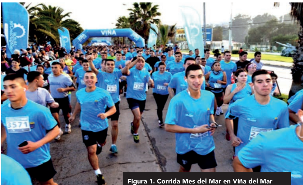
Figura 1. Corrida Mes del Mar en Viña del Mar

A través de la política medioambiental de la institución, la Armada aplica las normativas legales de protección del medioambiente, mediante acciones desarrolladas tanto al interior como al exterior de la institución. Al interior de la Institución, a cargo de la Dirección General de los Servicios de