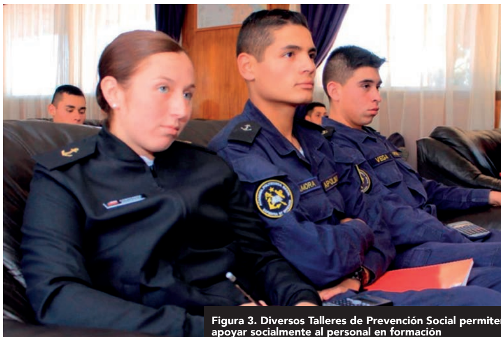
Figura 3. Diversos Talleres de Prevención Social permiten apoyar socialmente al personal en formación

La Oficina de Reinserción Laboral de la Dirección General del Personal de la Armada, asiste al personal que se acoge a retiro de la institución en materia laboral, creando un nexo entre el personal retirado y licenciado del servicio militar con empresas y organizaciones civiles, obteniendo de ellas posibles oportunidades de trabajo. A su vez, la Dirección de Educación de