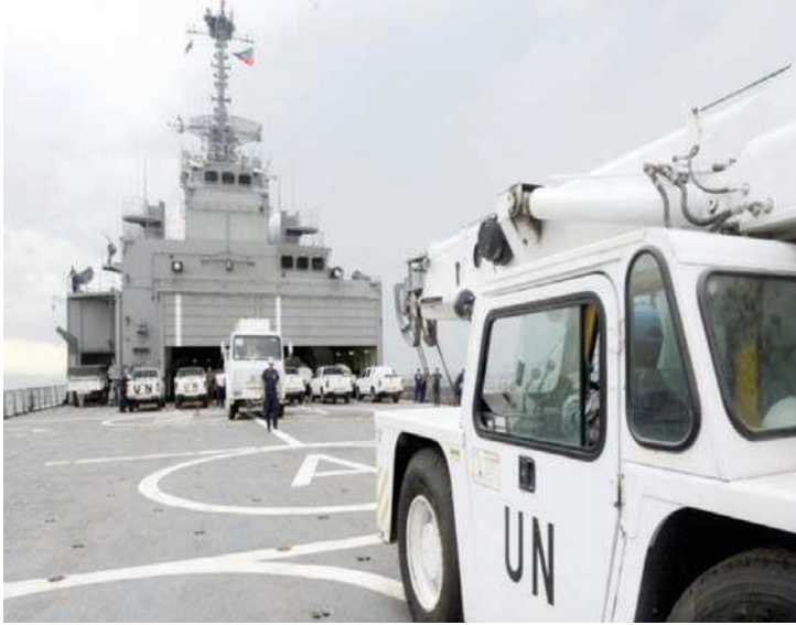
■ Embarco de vehículos a bordo del LSDH Sargento Aldea en Haití, junio 2017.

El equipamiento del material de habitabilidad y maestranzas del Batallón fue materializado por medio del viaje de carácter logístico de la LST Valdivia los años 2004 y 2006, permitiendo adecuar y ampliar las dependencias del cuartel.