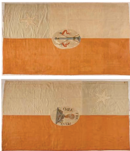
■ Bandera de la Jura de Independencia en 1818 (Museo Histórico Nacional).

La Bandera de la República de Chile, se compondrá de los tres colores azul turquí, blanco i rojo combinados del modo siguiente: la bandera se dividirá en dos fajas horizontales de igual anchura; la faja inferior será roja, i la faja superior será azul en su tercera parte inmediata a la vaina, i blanca en los dos tercios de su vuelo, con una estrella blanca de cinco picos en medio del cuadro azul. El diámetro de la estrella será igual a la mitad de un costado del cuadrado azul. Las proporciones de la bandera son: en la vaina, dos tercios de su vuelo”.