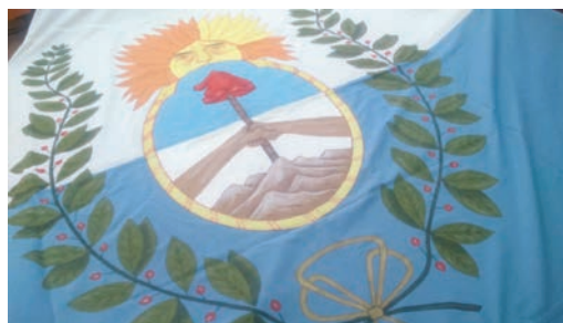
■ Bandera del Ejército de los Andes.