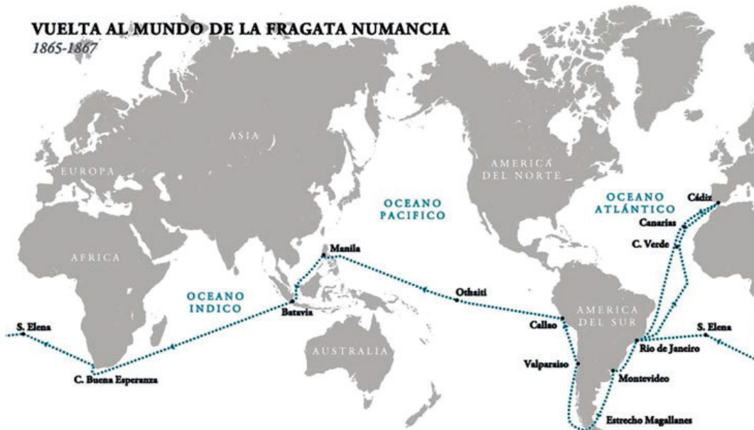
Ruta de la fragata "Numancia" 12

El 19 de enero de 1867 la "Numancia" zarpó de Manila rumbo a Java y Ciudad del Cabo. Desde allí a la isla de Santa Elena y, por expresas instrucciones del Gobierno, se dirigió a Río de Janeiro para unirse nuevamente a la escuadra de Méndez Núñez. Sin embargo, un brote de viruela, hizo aconsejable que abandonase Brasil