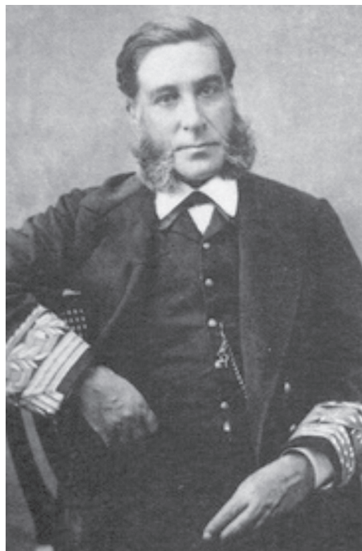
Contraalmirante Casto Méndez Núñez 4 .

Esta primera singladura no deja de ser interesante, pues las experiencias francesas y británicas, de largas navegaciones con buques blindados habían concluido en fracasos notables y ambas naciones consideraban que estas naves no eran aptas para ello. El buque no contaba con apoyos seguros en tierra y debía rellenar carbón periódicamente, pues sus bodegas eran de volumen limitado. La fragata carbonó en San Vicente de Cabo Verde el 13 de febrero y arribó a Montevideo el 13 de marzo, de donde partió el 2 de abril con rumbo al Estrecho de Magallanes acompañada del vapor "Marqués de la Victoria", que hacía de apoyo logístico para proveerla de carbón. Llegó a Valparaíso el 28