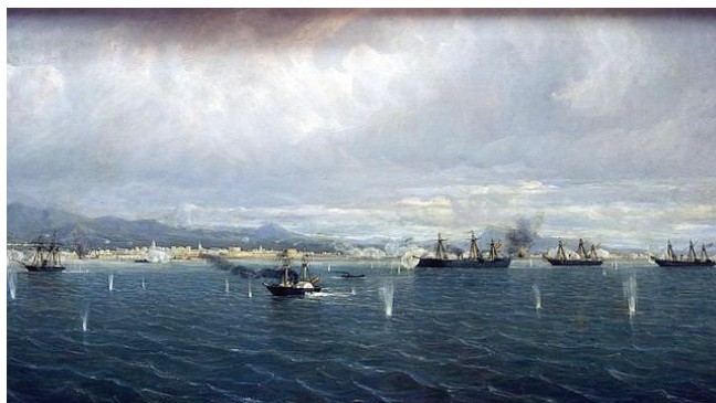
■ Combate del Callao, 2 de mayo de 1866 7 .

La decisión de bombardear Valparaíso se tomó ante el rechazo del gobierno de Chile por aceptar las condiciones impuestas por España a modo de compensación. La acción fue informada con 4 días de antelación, para que la población civil pudiera hacer abandono de la ciudad, pese a las infructuosas gestiones de agentes diplomáticos y comerciales y de los esfuerzos de las escuadras británica y estadounidense surtas en el puerto, que finalmente no intervendrían. El 31 de marzo de 1866, Sábado Santo, la fragata blindada dirigió el bombardeo del puerto sin participar efectivamente en él, por mantenerse a la retaguardia en previsión a un eventual ataque de la escuadra de Estados Unidos.