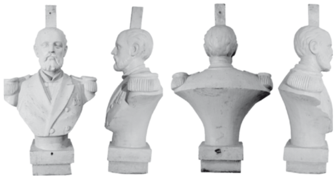
Modelo Escultórico de Arturo Prat con sus cuatro vistas.