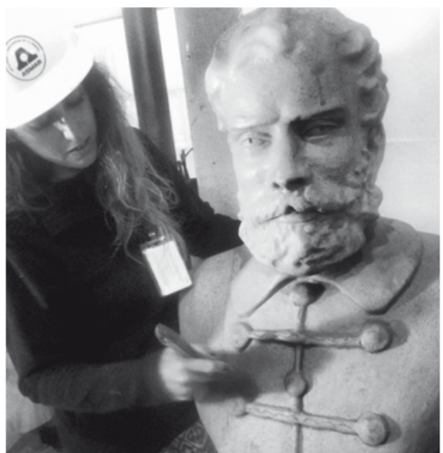
■ Limpiando Modelos para sesión fotográfica. Mayo 2013. Asmar (T).

tradiciones o saberes que provienen del pasado pero que aún siguen vivas. Sin embargo en la actualidad y en forma rápida, se pierde muchas veces el contexto social, técnico y cultural que dio sentido al objeto material que hoy patrimonializamos. Nos queda el martillo -de Limón- pero sin el golpe, porque muchas veces sólo permanece el objeto y el recuerdo en una memoria colectiva que se desvanece.