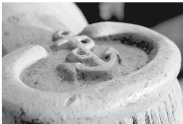
■ Modelo escultórico. Mayo 2013. (Fotografía Bárbara Siebert).

Conservemos lo que tenemos, para no perder nuestra herencia y patrimonio nacional.