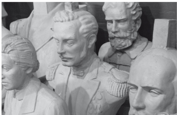
■ Detalle modelo escultórico. Mayo 2013. (Fotografía Bárbara Siebert).

Chile el verdadero aporte que ha sido la Armada para nuestro país.