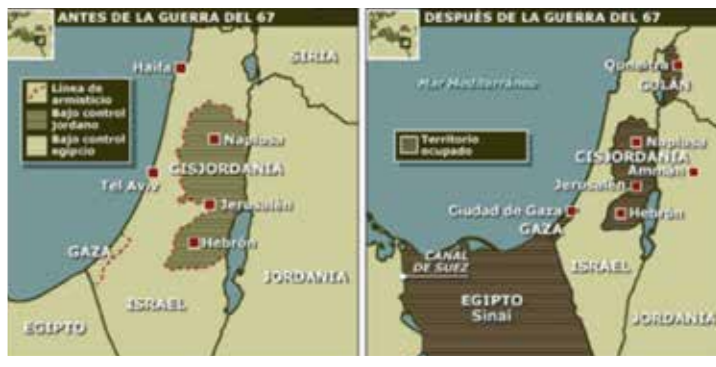
■ Guerra de los Seis Días, 1967.

Las negociaciones de paz tuvieron a tres actores relevantes, Estados Unidos, Rusia y la ONU. Aunque se