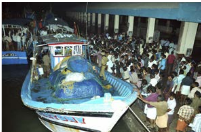
■ Pesquero indio "St. Antony".

El pesquero siguió su curso hasta una distancia de 100 metros del mercante italiano, aproximándose al centro de la nave, disparando