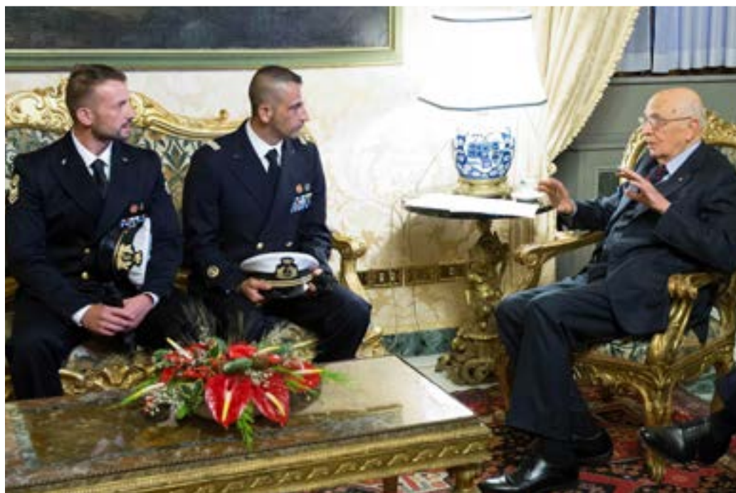
Autoridad italiana e involucrados.

El hecho ocurrió en la Zona Contigua de India (20,5 mn de sus costas), una zona funcional, la cual es tratada como Alta Mar para efectos que no sean "aduaneros, fiscales, de inmigración o sanitarios" (CONVEMAR Art. 33, 1.a). El buque podría haber continuado su tránsito hasta Egipto y posteriormente hasta Italia, desembarcando a los acusados en su propio país, habiendo dado