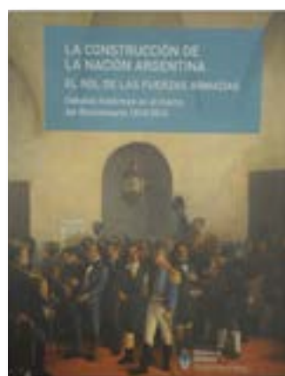
“La Construcción de la Nación Argentina. El rol de las Fuerzas Armadas”

Mons. Joao Scognamiglio Clá Dias. Edición 2013, 432 pp.