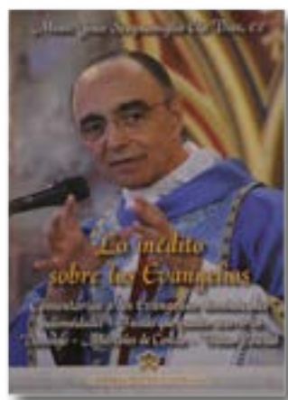
“Lo inédito sobre los Evangelios”