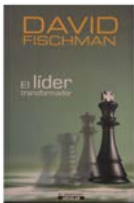
“El líder transformador”