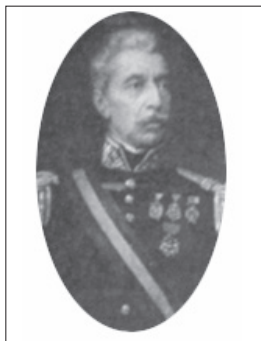
General José Santiago Aldunate. Ministro de Marina.