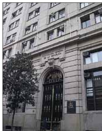
Contraloría General de la República.

Por otra parte, los organismos constitucionalmente autónomos, como la Contraloría General de la República, el Banco Central, el Ministerio Público, el Tribunal Constitucional y la Justicia Electoral, sólo tienen la obligación de cumplir con las disposiciones de Transparencia Activa, manteniendo a disposición del público en sus sitios institucionales aquella información que la ley les señala. Asimismo, estos organismos deben generar sus propios mecanismos internos para gestionar las solicitudes de información que las personas pudieran hacerles, pero no están sometidos al control del Consejo para la Transparencia.