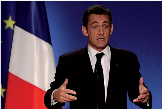
Presidente Nicolás SARKOZY.

A partir de esta reflexión, su Presidente, Nicolás SARKOZY, plantea dos objetivos: