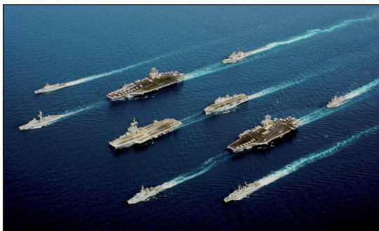
Los portaaviones son una auténtica base de operaciones flotante que pueden desplazarse a cualquier parte del mundo.

Basada en el empleo gradual de medios, siempre bajo la doctrina de evitar la utilización de medios nucleares. Ésta se materializa con cuatro submarinos balísticos, dependientes de la Fuerza Estratégica Oceánica (FOST) 11 , además de las aeronaves que poseen la capacidad de portar misiles con cabeza nuclear y que se encuentran embarcados en el portaaviones “ Charles de Gaulle ”, como parte de la denominada Fuerza Aeronaval Nuclear (FANU) 12 .