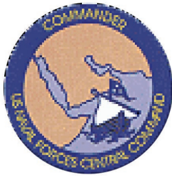
Escudo de la Quinta Flota de EEUU.

vada en 1947. Posteriormente y derivado de las acciones bélicas en la zona, fue reactivada en 1995, manteniendo el control de las Fuerzas Navales asignadas a esa área.