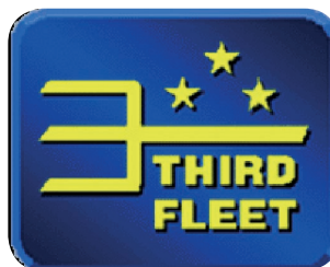
Escudo de la Tercera Flota de EE.UU.

Esta Flota es dependiente de la componente Naval de las Fuerzas del Pacífico y tiene como tarea principal entrenar a las Unidades que se despliegan a los Teatros, conformando Grupos de Batalla o Grupos Expedicionarios. Actualmente, su área