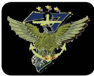
Escudo de la Sexta Flota de EEUU.