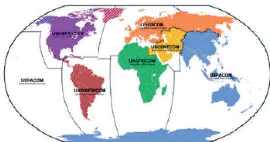
Áreas de responsabilidad de los Comandos Unificados.