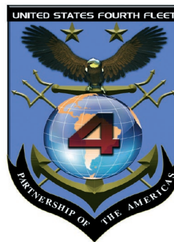
Escudo de la Cuarta Flota de EEUU.

El presente escrito tiene por propósito dar a conocer las Flotas que tiene la US Navy, las principales actividades que realiza actualmente la Componente Naval del Comando Sur y que pasarán a efectuar las Unidades asignadas a la Cuarta Flota recientemente reestablecida, y analizar algunas implicancias que se le asumen en el rol que podría cumplir en la región.