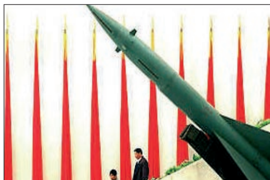
Misiles chinos, constituyen una potencial amenaza.

Se suma a lo anterior la inestabilidad que generan algunos problemas vigen-