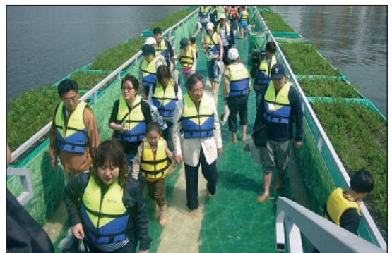
El puente Acuático del Milagro en el río Han de 300 metros, instalado entre la isla Noduel y la zona de Ichon.

Desde la Guerra de Corea que existe una alianza estratégica entre ambos países (ROK-US) y aunque todos los aliados que hoy controlan el acuerdo de armisticio (UNMAC) velan por la seguridad de la península, el rol de EE.UU. ha sido gravitante, manteniendo las fuerzas adecuadas en la región y ejerciendo el control operacional en tiempo de guerra (US Force Korea), ayudando significativamente al desarrollo surcoreano conocido como el "Milagro del Río Han". A pesar de la enorme amenaza de Corea del Norte, que en múltiples oportunidades ha creado incidentes que violan el acuerdo de tregua, manteniendo en permanente alistamiento un ejército de más de un millón de efectivos, con muchas piezas de artillería desplegadas en la frontera que alcanzan a Seúl y otros objetivos estratégicos claves, además de desarrollar armas nucleares y poseer muchos misiles, aviones de combate y unidades navales que amenazan cualquier parte del territorio, la presencia militar norteamericana para apoyar a las fuerzas surcoreanas, con tropas, medios navales y aéreos que operan desde