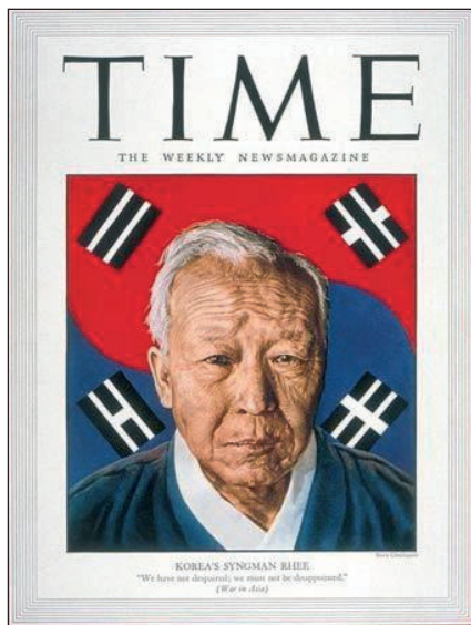
El Time de la época, destaca en su portada al primer Presidente de la República de Corea del Sur, Dr. Rhee Syngman.

Ambas constituciones políticas declaraban que toda la península era parte del territorio nacional y desde septiembre de 1948 el norte instigó diversos paros de trabajadores, levantamientos e insurrecciones en el sur, abogando por la reunificación del país y provocando una serie de incidentes militares en la frontera que elevaron la tensión y llevaron fácilmente a la Guerra de Corea que comenzó el 25 de junio de 1950 cuando Corea del Norte, apoyada por China y la URSS, invadió al país del sur con el supuesto de “liberar la otra mitad de la República” y para provocar la “revolución coreana”, calculando erróneamente que EE.UU. no intervendría en un eventual conflicto, considerando una reciente declaración de ese país que excluía a Corea del Sur de su “perímetro de seguridad”.