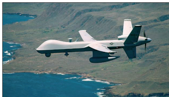
Espacio de batalla, un oportuno acceso a la información.

Esta visión, motivada por los avances tecnológicos de las últimas décadas, aún a nivel de teoría por encontrarse en pleno desarrollo, busca desarrollar Operaciones Net-Centric (NCO), por medio de las cuales se incrementan progresivamente las capacidades de C2 a partir de los sistemas existentes, destacándose