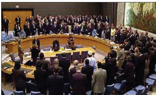
Organización de Naciones Unidas.

Los conceptos de Democracia y Seguridad en nuestra legislación, conviven, complementan y refuerzan la unidad del Estado-Nación porque ambos están