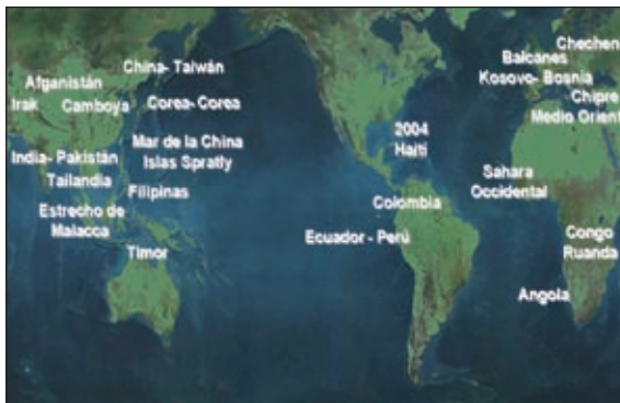
El conflicto convencional y subconvencional bajo el fenómeno globalizador.

Asimismo, tal como señala el mapa inferior, conflictos latentes y guerras recién pasadas, como el caso de China con Taiwán, el de Pakistán y la India, el