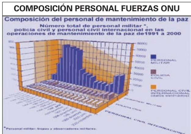
En total 750.000 hombres han participado en operaciones de paz, falleciendo 171 soldados.

Es como en este ambiente de cambios, actualmente, los Estados Nación no sólo están expuestos a la clásica amenaza de otro Estado, sino que también deben sobrellevar los peligros que traen estos nuevos actores no estatales con gran capacidad para vulnerar las estructuras gubernamentales debido a una peligrosa permeabiliza-