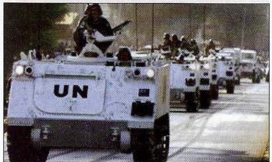
Fuerzas de inteligencia de la ONU.

C.- El conocimiento de la geografía física, social, política, económica, humana