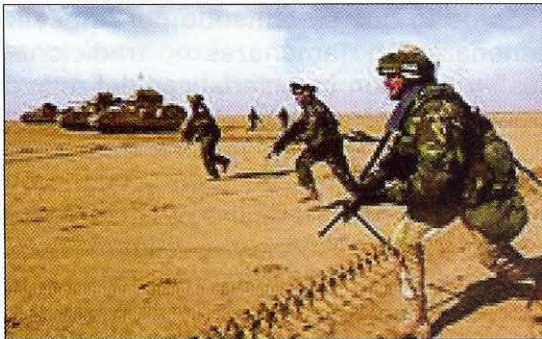
Ofensiva militar en el Golfo Pérsico.

El término Asimetría es utilizado para resaltar el empleo algún tipo de diferencia para obtener ventajas sobre un adversario. Muchos de los mejores generales de la historia, tenían un instinto especial para su aplicación. Muy similar a las tácticas utilizadas por el Ejército de los Estados Unidos en la Guerra del Golfo Pérsico, los mongoles bajo el mando de Genghis Khan y sus sucesores, emplearon a menudo una movilidad superior, rapidez en las operaciones, inteligencia, sincronización, adiestramiento y moral para derrotar a sus enemigos en campañas relámpago.