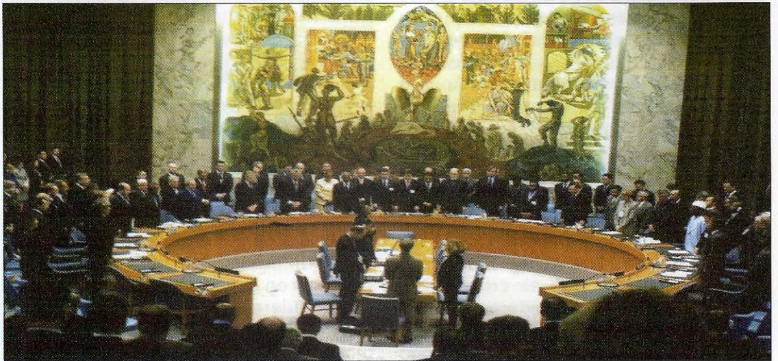
Sesión del Consejo de Seguridad de las Naciones Unidas.

El informe Brahimi 3 entre los aspectos más importantes que pudo concluir estaba el hecho de que la preparación de las Fuerzas que se desplegaban como Peace Keeping, poseían una absoluta