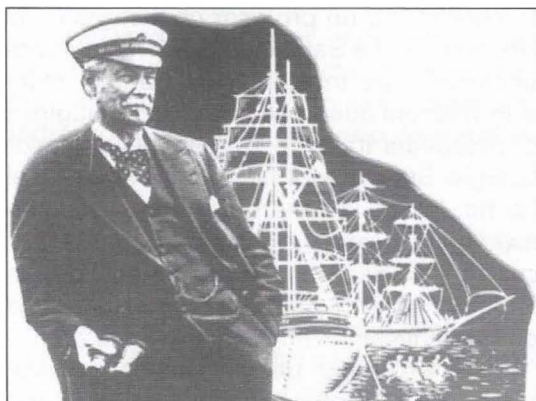
La arroba se utilizaba por ejemplo en los registros mercantiles de naves de carga.

.... "ningún símbolo nace de la nada y ningún símbolo se elige por casualidad", explica el historiador. La "chiocciola" tiene por lo tanto un origen italiano vinculado al comercio y a la navegación verdadera, aquella que se hacía con veleros que no tenían nada de virtual y que viajaban cargados de mercaderías exóticas. La arroba es el símbolo de la pericia de los marineros, las batallas contra el mar, el mundo de la navegación, cuando navegar era un desafío. El mismo profesor Stabile destaca de la "arroba" se utilizaba por ejemplo en los registros mercantiles de las naves de carga que atracaban en las costas árabes