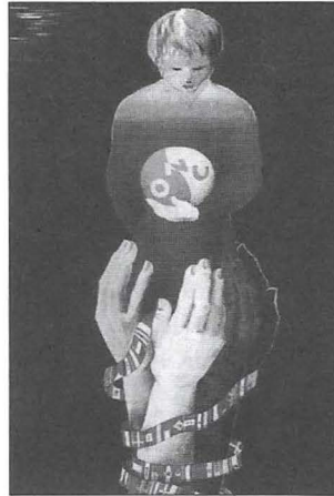
Los temas relacionados con los derechos de los niños son una preocupación preferente de la ONU.

En la tercera reunión ministerial de Petra, celebrada entre el 11 y 12 de mayo de 2001, se analizaron temas relacionados con el desarrollo y la seguridad humana; la solución y prevención de conflictos; la necesidad de fortalecer las misiones de paz de la ONU; y la inseguridad de los niños debido a las situaciones de violencia. Por otra parte, se adiciona a la agenda, el tema del SIDA. Chile ha participado en las tres reuniones y, en la última de ellas, reconoce la importancia de continuar enfocando la atención en los