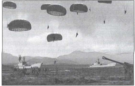
Fuerzas anfibias y aerotransportadas.

La Doctrina Anfibia Británica se orienta a "dislocar, romper y destruir la efectividad del enemigo". También se expresa en que es un estilo de combate que persigue colapsar la cohesión del enemigo, a través de una serie de acciones rápidas, violentas e inesperadas, para crearle una situación turbulenta que lo deteriorará rápidamente, situación que el enemigo no podrá controlar. La concepción anfibia tiene como fin último, producir resultados negativos en la voluntad del enemigo, los que se incrementarán con el tiempo, antes que incrementar la atrición de sus capacidades. Se expone que se basa en conceptos como la sorpresa y velocidad, los que se explotarán en mejor forma, posicionando una Fuerza Anfibia más allá del horizonte y accionando sobre el flanco marítimo. Los logros operacionales se obtendrán mediante la capacidad de la fuerza para expandir el campo de batalla terrestre, exponiendo al centro de gravedad enemigo a una amenaza inesperada, creíble y dinámica. La adecuada ejecución de una maniobra anfibia desde el mar, se basa en la explotación de la sinergia derivada de los efectos combinados de fuerzas de mar, aire y tierra para aplicar los efectos de la potencia de combate del poder naval, sobre el litoral seleccionado.