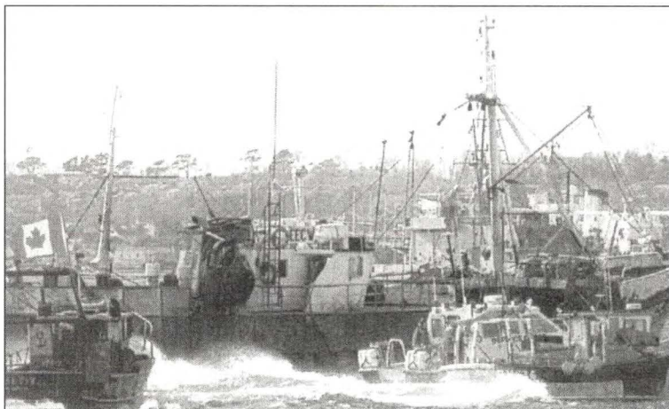
La Guerra de Fletan entre Canadá y España frente a las costas de Terranova.

Desde hace algún tiempo a la fecha se encuentran operando en las inmediaciones de las islas Falckland y Georgias del Sur, varios buques pesqueros chilenos con artes de pesca de arrastre y aparejos de espineles, en busca del