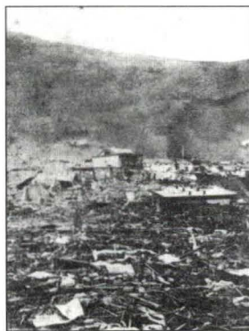
La vista muestra un sector de la ciudad destruida, entre las actuales calles Baquedano y Colón.

Apuré el paso y en cuanto alcancé la periferia del pueblo, miré para atrás y vi todos los buques en la bahía arrastrados irresistiblemente mar adentro, a una velocidad probable de diez millas por hora. En pocos