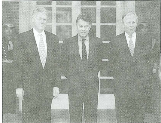
William Clinton, Felipe González, Jacques Santer.

En el primer párrafo del documento oficial se lee: "Nosotros, los Estados Unidos de América