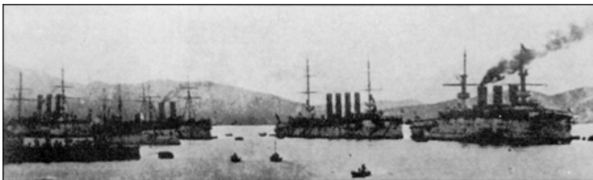
Flota rusa en Puerto Arturo. Aparecen el crucero Diana, el cañonero Korejetz, el crucero Varjag, el acorazado Peresviet y otras unidades menores, entre ellas un caza torpederos.

Esta fundamental operación de DCM es producto de una maniobra concebida para accionar decididamente contra el objetivo principal representado por la fuerza principal adversaria, dividida o parte de ella. Sus características más notables son, que puede constituir una respuesta al ataque adversario y que elude la decisión, hasta crear circunstancias favorables que permitan asegurar la destrucción de las fuerzas navales principales oponentes.