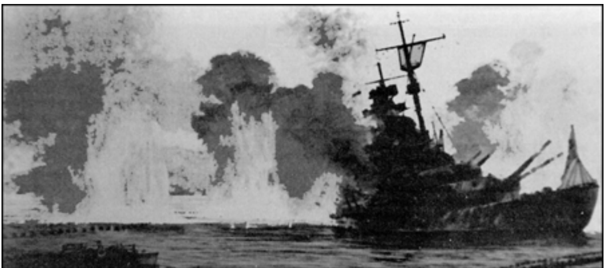
El hundimiento del Tirpitz en aguas de Tomsó, alcanzado por las bombas perforantes de 10 t., lanzadas con gran precisión por los cuadrimotores "Lancaster" de la RAF. (Pintura de Chrys Mayger).

Estas operaciones son realizadas por otros medios (antiguamente denominados fuerzas secundarias) que no pertenecen a la fuerza organizada y que accionan contra la fuerza organizada enemiga, o parte de esta, explotando ampliamente la sorpresa táctica y técnica que sus características operativas les permiten y para cuyo sistema de armas no existe una respuesta adecuada.