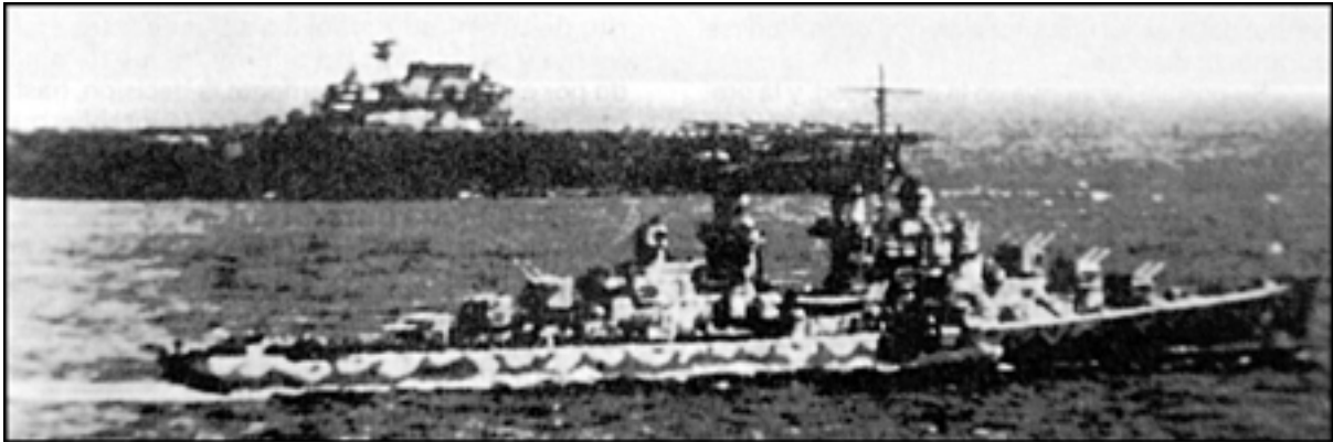
El crucero Atlanta y el Portaaviones Hornet en una de las fases de aproximación de las flotas adversarias. (Batalla Midway, 4 de junio de 1942).

Fue un típico éxito estratégico de EE.UU.; éxito que permitió a esta potencia la iniciación de vigorosas operaciones de DCM, junto con la iniciación de su potente ofensiva estratégica a través del Pacífico central para las sucesivas conquistas de las posiciones estratégicas que permitieron el aniquilamiento de la Flota Imperial y la ejecución de las operaciones de proyección de EE.UU. contra islas del Pacífico y el territorio metropolitano del Japón, que condujeron a la derrota definitiva de este enemigo.