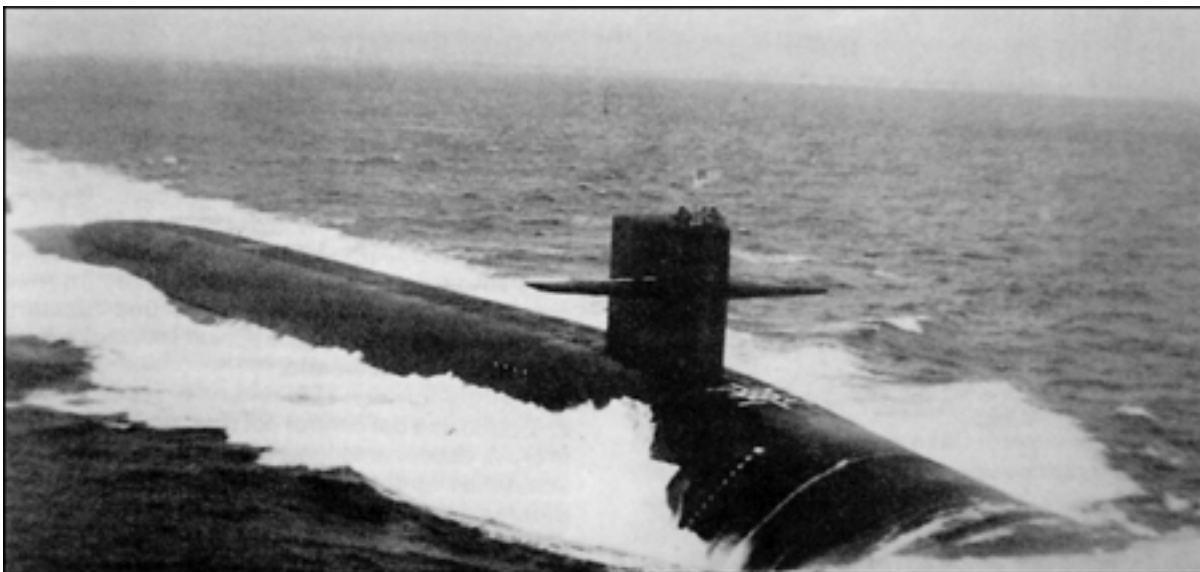
La USS Georgia (SSBN-729) submarino nuclear lanzamisiles.

Antiguamente se mencionaban como "nuevos medios" el avión y el submarino, unidades cuyas características operativas las capacitaban especialmente para el contraataque menor y, normalmente, no eran incluidas en la fuerza organizada o fuerzas navales principales.