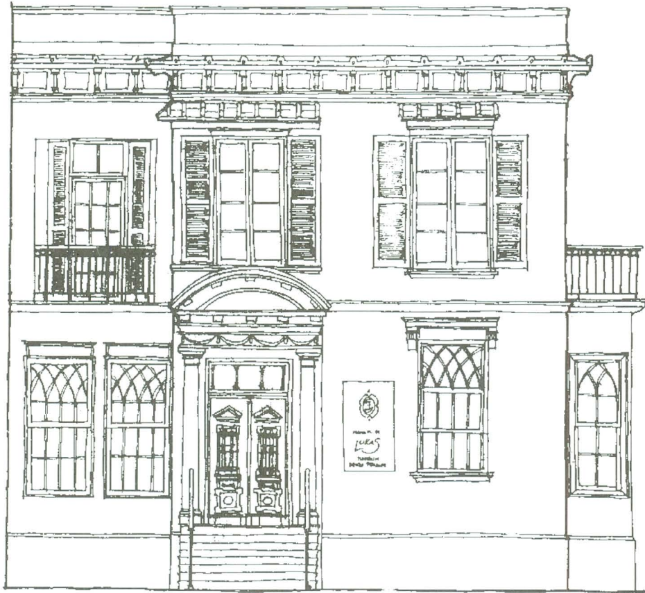
Fachada de la casa "el mirador de Lukas"

Un objetivo a mediano plazo es construir en el paseo Gervasoni, sobre un retazo de terreno que pertenece a la propiedad, un balcón mirador sobre la bahía, que haga más atractivo el paseo, otorgue identidad al sector y vincule el nombre de Lukas a una obra importante de mejoramiento urbano.