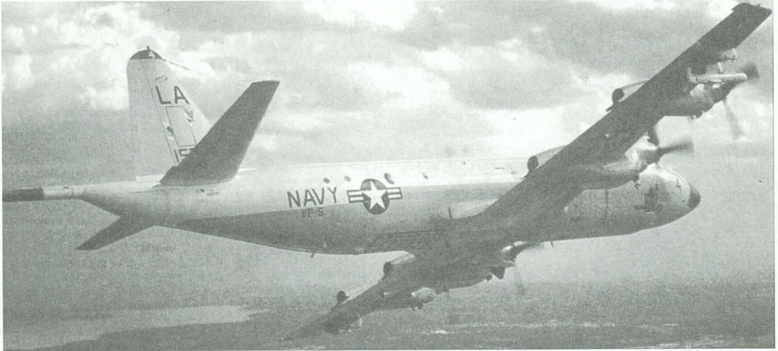
AVION "ORION" P-3C

La armada de este país todavía debate respecto a la futura aeronave de exploración aeromárítima, transcurridos seis meses después que cancelara el programa del P-7A por problemas financieros. Al respecto se baraja tres opciones: Una considera el mejoramiento de la aeronave Orion P-3C. Equipada con alas y motores nuevos, esta opción prolongaría en 15 a 20 años la vida útil de los actuales P-3C. Otra opción sugiere la compra de nuevos P-3 a la Lockheed Corp. Finalmente, una tercera alternativa se refiere a desarrollar un nuevo avión; sin embargo surgen dudas sobre la factibilidad financiera de desarrollar una nueva línea de producción.