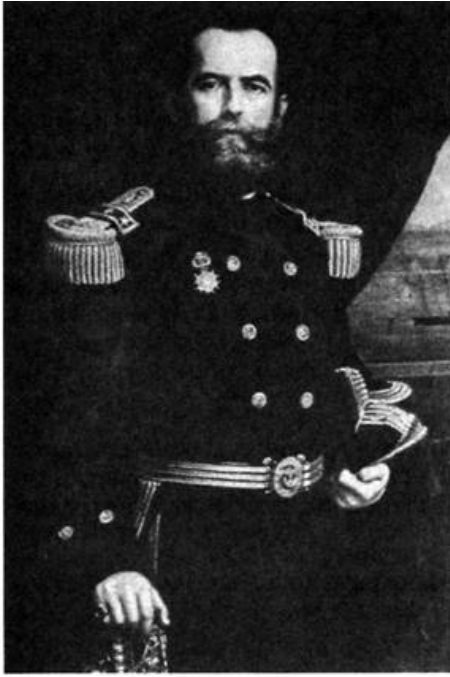
CAPITAN DE FRAGATA DON JUAN WILLIAMS REBOLLEDO, COMANDANTE DE LA "ESMERALDA" Y DE LA DIVISION NAVAL CHILENA

En su regreso al sur, y con la idea de aprovechar la errónea distribución de buques aislados que había hecho Pareja, Williams, después de rellenar carbón en Lota, se dirige al norte y captura a la Covadonga en el combate de Papudo, el 26 de noviembre de 1865. Continuó al sur, con intenciones de sorprender y capturar a la goleta Vencedora , pero desistió ante la imperativa orden del gobierno de dirigirse a Chiloé (se la perdió por 6 horas), recalando en Ancud los primeros días de diciembre.