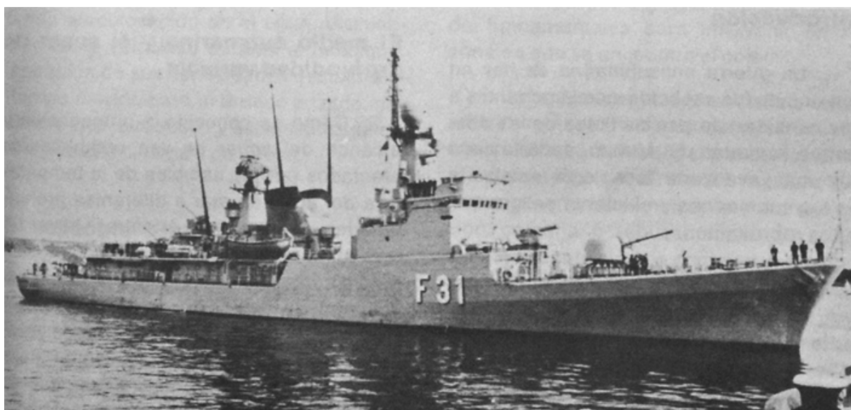
FRAGATA CLASE DESCUBIERTA

Unidades de esta clase han sido adquiridas por la Armada de España y vendidas a las Armadas de Marruecos y de Egipto.