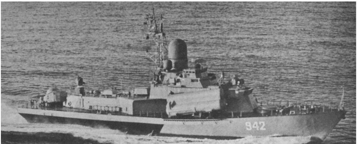
CORBETA MISILERA CLASE NANUCHKA

Poseen 4 misiles superficie-superficie, del tipo SSN 2B y misiles superficie-aire, del tipo SA-N-4 (doble).