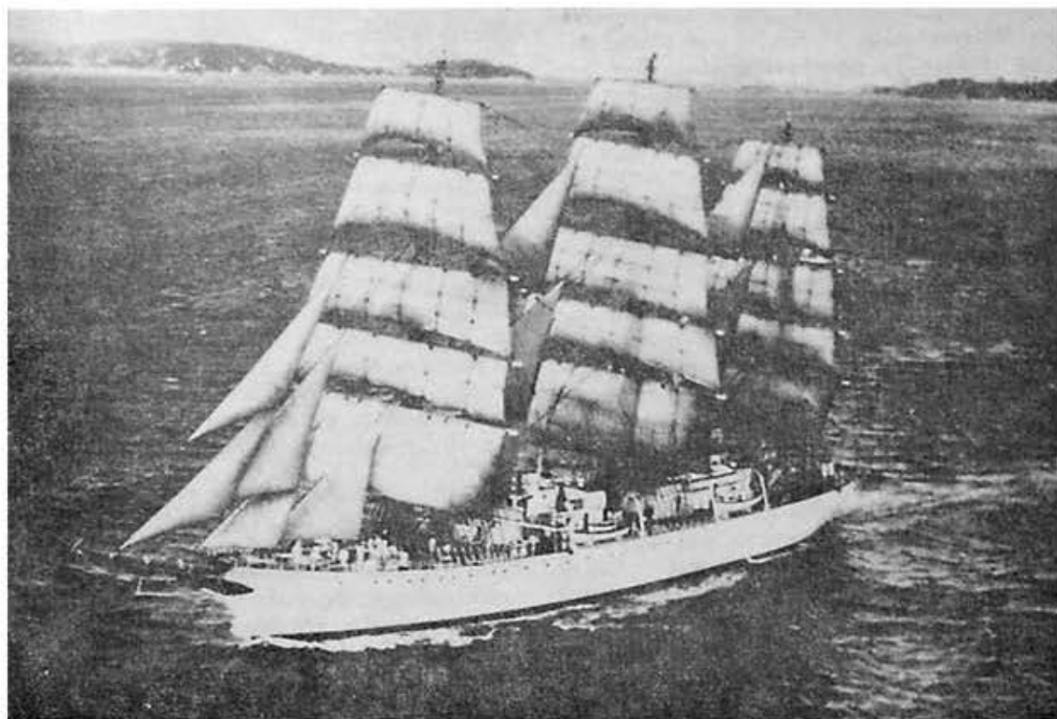
Buque Escuela argentino "Libertad".

El lunes 18 de julio se efectuó una ceremonia en el monumento a los héroes de Iquique, visitas a bordo y un cocktail