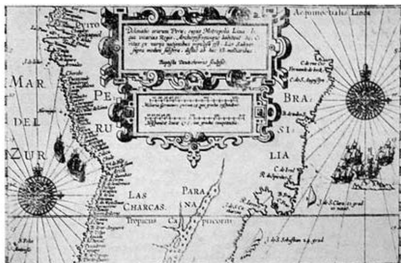
Se muestra al sur la isla San Sebastián, Mapa de 1599.

se menciona actividad alguna, fuera de aprovisionamiento y atención de enfermos; sin embargo, parece que los barcos se dedicaron, además, a la caza de buques enemigos, aun cuando el relato de viaje no lo menciona.