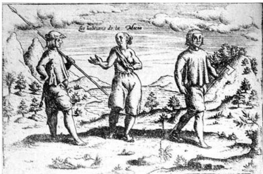
Habitantes de Isla Mocha.

El trato con los indígenas independientes de los españoles era amistoso. Los holandeses notaron que los indios tomaban tantas mujeres como podían mantener. Las compraban a sus padres por bueyes, ovejas y otras cosas. Por esto, los padres con muchas hijas eran ricos. Los hombres tenían el cabello largo, las mujeres lo usaban en moños (Fig. 7). Los