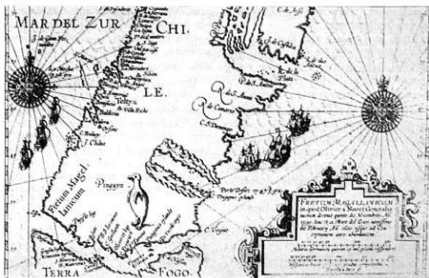
Entrada oriental al Estrecho de Magallanes.

gando que comían avestruces, e. d. que cazaban en su territorio. Los holandeses suponían que todos estos indios eran caníbales.