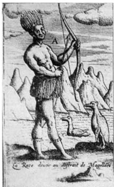
Indio armado de arco y flechas.

El 29 de octubre la flotilla siguió viaje al sur y llegó el 4 de noviembre al Cabo Vírgenes. El 22 de ese mes se produjo el primer encuentro con un indígena fueguino. En la playa del lado sur de la entrada al Estrecho había un hombre con la cara pintada, una manta en la espalda, corriendo, bailando y saltando hacia los buques. No era más alto que un holandés. Tierra adentro se veían más indios. El almirante envió un bote a la playa y se dispararon 5 ó 6 tiros contra ellos. El indio no sabía qué significaba el fuego y por último se retiró despacio. Se comprueba que esos indios, de tribu indefinida, no conocían aún las armas de fuego. Es interesante el cuadro de un indio armado de arco y flecha (Fig. 4).