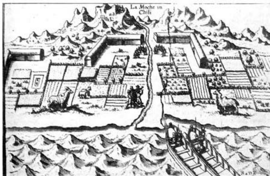
Caserío de Isla Mocha.

Se produjo otro encuentro con los indígenas. Al mariscar, algunos expedicionarios fueron atacados por indios armados de mazas y lanzas. Dos holandeses fueron muertos y uno herido. Los indios se dieron a la fuga, llevando consi-