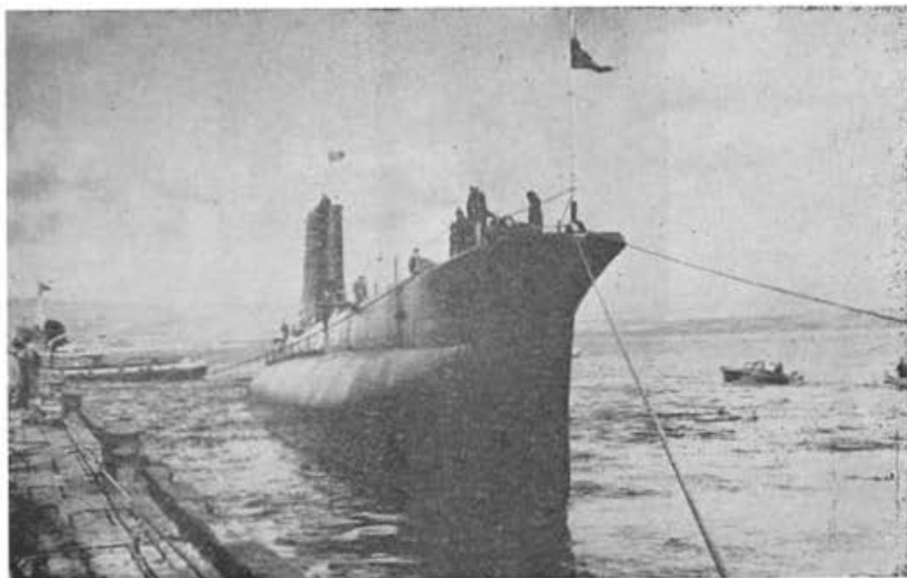
Submarino chileno "Hyatt" después de lanzado.

E l miércoles 26 de septiembre fue botado al agua en los Astilleros de Scott's Shipbuilding Company Limited, en Escocia, el submarino "Hyatt" que se encontraba en gradas en Gran Bretaña para la Armada de Chile. Esta es la segunda de dos unidades de su tipo que Chile mandó construir en el mencionado país. El otro submarino, "O'Brien", fue lanzado en diciembre del año pasado y actualmente se halla en un avanzado proceso de terminación a flote.