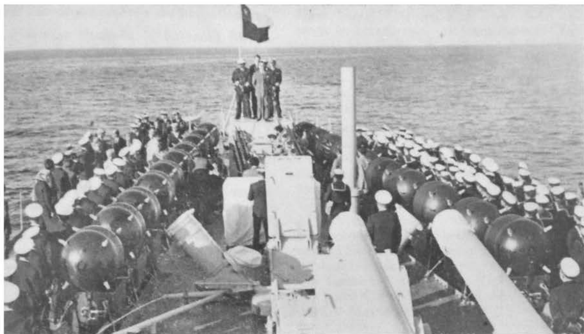
Vista panorámica de la popa del "Latorre", en los momentos en que habla S. E. frente a la tripulación formada.

recepción del "Latorre". Con este propósito a las 7 horas de esta mañana partió a Puerto Aldea un microbús de la Armada conduciendo a los periodistas. Estos serán embarcados en los diferentes buques de la Escuadra poco antes de la llegada del Presidente de la República y se desembarcarán junto con las autoridades en Valparaíso.