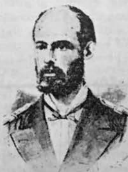
Arturo Prat Chacón

Su capacidad y dotes diplomáticas fueron demostradas en la reunión oficial en-