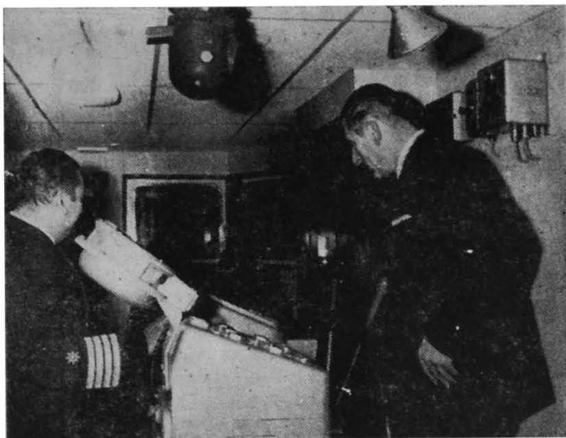
S. E. en el puesto de mando del "Lago Llanquihue".

trucción, es de 16 nudos, pero en las pruebas que se efectuaron antes de su entrega rindió 18 nudos como promedio.