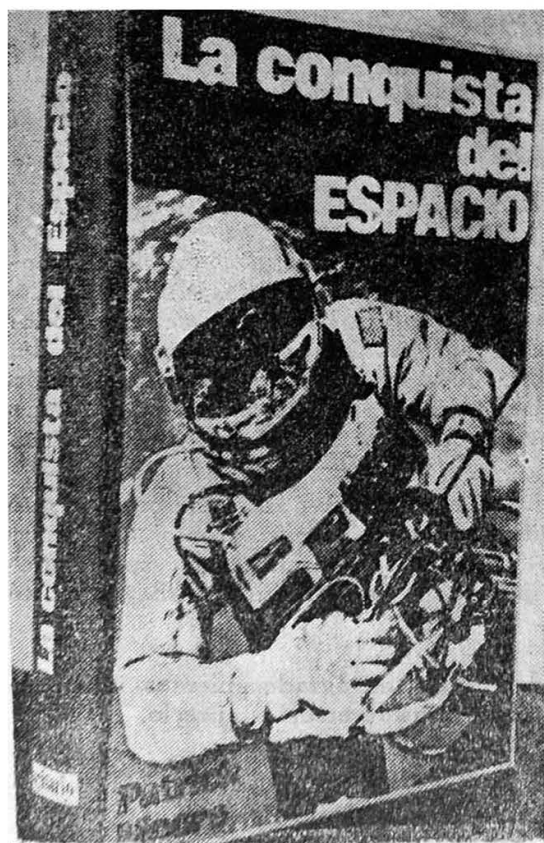
"LA CONQUISTA DEL ESPACIO".— Patric Moore.

RECOMENDAMOS LOS SIGUIENTES LIBROS QUE SE ENCUENTRAN DIS- PONIBLES EN LA BIBLIOTECA DE LA REVISTA DE MARINA: