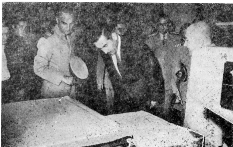
El Ministro de Defensa Nacional observa el trabajo de reproducción de cartas náuticas.

operativa del Instituto, siendo ampliamente informado por su Director.