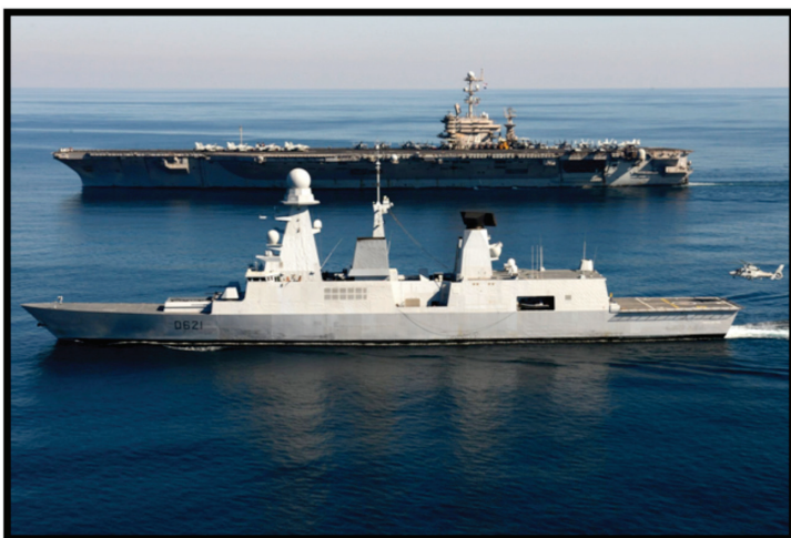
■ Fragata francesa clase Horizon

Oriente y de nuestro país, 4 quienes deseaban un incremento sustancial en el alcance y la capacidad de impactar blancos en ambientes congestionados.