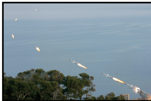
■ Misil Exocet MM-40 Block 3 realizando giro posterior al lanzamiento

Además, como una de las principales características innovadoras de este misil, en su fase final se desplaza con una maniobra terminal tipo tirabuzón. Esta maniobra que incluye movimientos en los planos vertical y