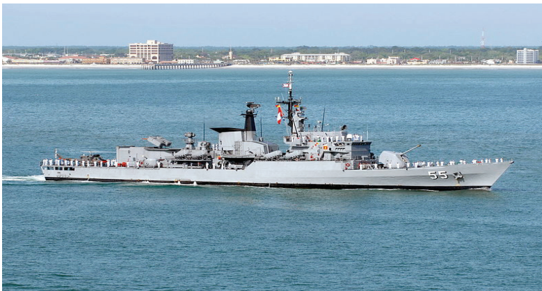
■ Fragata Clase Lupo BAP 55 "Aguirre"

Como parte de los criterios de compatibilidad dispuestos para este misil, se estableció una arquitectura abierta para el diseño del módulo de control de armas ITL 70A-B3. Este módulo tiene la gracia de ser compatible con las anteriores versiones del misil MM-40, permitiendo la