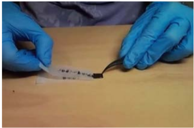
■ Restos de grafito adheridos a una cinta adhesiva.

El comunicado de la Academia señalaba que: “El grafeno es una forma de carbono. Como material, es completamente nuevo, no sólo es