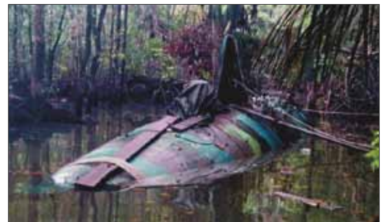
Submarino, un medio sofisticado usado actualmente por los traficantes.

Garantizar y administrar los esfuerzos para que estén en consonancia con la Unidad de Mando, y así evitar fisuras entre los conceptos de mando y control