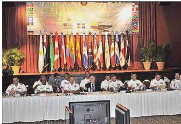
Simposio Marítimo Contra el Narcotráfico en el Continente Americano.