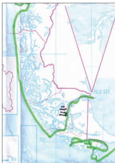
Exploración marítima a Chiloé y Golfo de Penas. (Noviembre de 1834 a febrero de 1835).