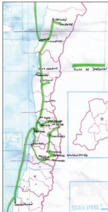
Primeras exploraciones terrestres al interior de la Zona Central (agosto a octubre de 1834), exploración a través de la Cordillera a Argentina (marzo 1835 a abril de 1835), exploración al Desierto de Atacama (abril 1835 a julio 1835).