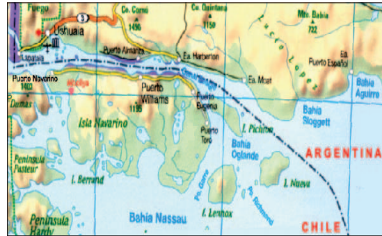
Bahía Wulaia en Isla Navarino desembarcan al misionero Rev. Mathews.

Entre diciembre de 1832 y febrero de 1833 permanece en el área de los canales Fueguinos, en botes explora el canal Beagle occidental, brazos Noroeste y Suroeste. (Islas Wollaston, Isla Navarino, Paso Goree y bahía Cook). Se maravilla de los imponentes y altos glaciales. Posteriormente durante casi un año la “Beagle” apoya logísticamente a las Islas Falkland (recientemente anexada a la corona británica). Explora esa área, se dirige luego a la Patagonia Argentina donde la Beagle realiza sus reparaciones y manutención de invierno.