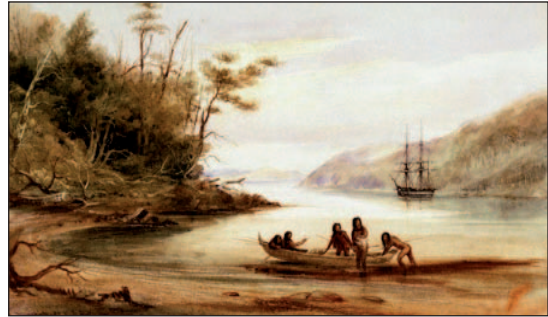
El 10 de noviembre de 1834, la "Beagle" se dirige a Chiloé y archipiélago de Chonos.

El buque permanece en Aguantao hasta el 4 de febrero, zarpando luego a