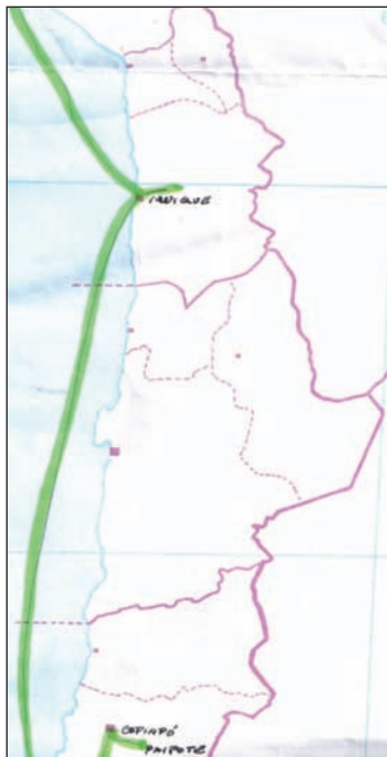
Última etapa de la permanencia en Chile.