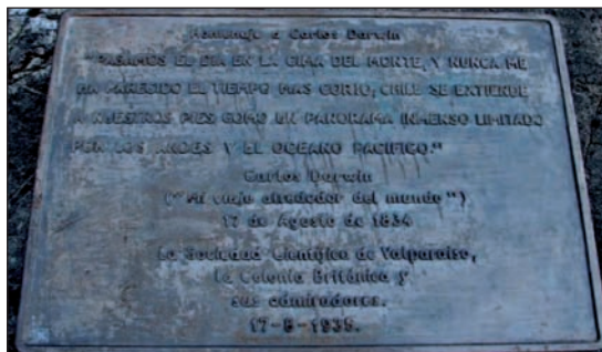
Placa de Darwin en cerro La Campana Olmué, Chile.

valle costero y comprende el significado de "Valle del Paraíso". Llega a la hacienda de San Isidro, escala el cerro "Campana" y se maravilla de las palmas silvestres en la ladera y del proceso de extracción de la miel en que se derriba el árbol y queda tendido en la ladera del cerro mientras la miel cae por gravedad a un tambor. Recorre en detalle el valle de Quillota y luego continúa a la mina de cobre en Jahuel donde descansa por unos días.