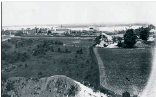
Fig. 2: Astillero Pitcher de Northfleet, alrededor de 1860.

Sin embargo en 1913, Thomas Pitcher comenzó a usar en la construcción "devils" (en castellano demonios), que era la marca comercial de unos clavos de acero con la cabeza de cobre, en reemplazo de clavos de cobre usuales. Estos clavos de acero se corroían rápidamente por la acción electrolítica del agua de mar y constituían un peligro. El resultado de un ahorro mal entendido y el riesgo asociado llevaron a Thomas Pitcher a perder todos los contratos con el Almirantazgo británico y la Compañía East India 8 .