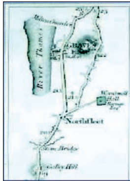
Fig. 1: Antiguo mapa que muestra la ubicación de Northfleet.

En la Figura N o 1 se puede apreciar la conformación del río en esa época y las diversas localidades ubicadas a lo largo de éste. A la ciudad se accedía desde Londres, por un servicio de tren a vapor, cuyo viaje duraba alrededor de una hora y media.