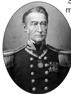
Contraalmirante Roberto Simpson.