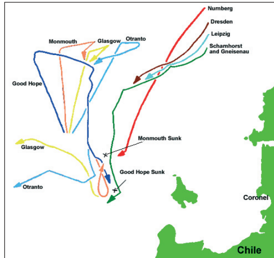
Batalla de Coronel, 1 de noviembre de 1914.

A las 16:00 horas, el H.M.S. Glasgow divisó los humos al noreste de una unidad de combate alemana, a poco andar, resultaron ser tres siluetas, el S.M.S. 10 Scharnhorst , S.M.S. Gneisenau y S.M.S. Leipzig que navegaban a su vez en formación 1 de norte a sur encabezados por el buque insignia y cerraba la formación (aparentemente) el Leipzig . En este momento, Cradock tuvo la primera oportunidad de evitar el combate y retornar mar afuera y esperar la noche para perder a los germanos, pero prefirió presentar batalla e intentar la clásica táctica naval de cortar la proa enemiga y formar la T con el objeto de enfrentar con todas sus fuerzas a los buques alemanes