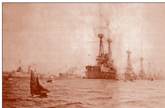
La gran flota, orgullo de la Marina británica, en 1914.

Al romperse las hostilidades, comenzó por parte del almirantazgo inglés la ejecución de su planeamiento naval para el conflicto en el ámbito mundial, para ello se bloquearon los accesos al mar del norte y obligaron a las unidades de superficie alemanas a permanecer guarecidas en sus puertos, siendo muy difícil a partir de ese momento para ellas poder salvar el bloqueo. 4 Como una segunda fase, bloquearon el acceso al mediterráneo y confinaron a las unidades alemanas existentes en dicha zona (los cruceros S.M.S. Goeben y el S.M.S. Breslau ) a replegarse al interior del Bósforo en aguas turcas, por lo que no existía fuerza alguna capaz de oponerse a los intereses británicos