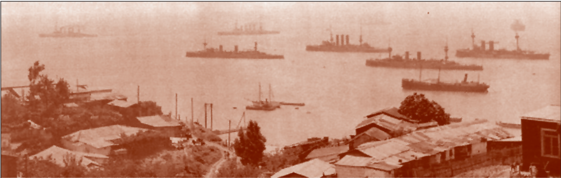
Los cruceros pesados alemanes en Valparaíso, luego del combate de Coronel, al fondo las unidades de la Escuadra Nacional.

rumbo hacia Valparaíso a reparar las averías y luego a la base naval inglesa de las Falkland, pero los británicos que estaban estupefactos por la derrota ya habían tomado las medidas necesarias para remediar los hechos del 1 de noviembre y es parte de otro trabajo más profundo analizar lo que aconteció a las unidades alemanas el 8 de diciembre del mismo año, vale decir poco más de un mes después de ocurrido los hechos de Coronel.