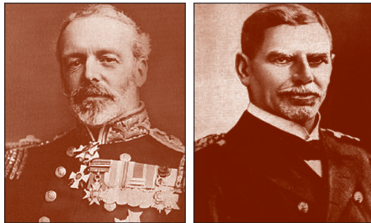
Contraalmirante Christopher George Kit Cradock.

Las opciones del Contraalmirante Cradock no eran muchas, sabía que desde la Batalla de Trafalgar en 1805 no había existido fuerza naval alguna que volviera a amenazar la supremacía británica en el mar, y la tradición impuesta por Nelson, impedía aun al más débil de los faluchos británicos rehusar combate, por lo que su Escuadrón no sería la excepción. Estaba entonces condenado a presentar batalla a los alemanes para impedirles el paso por el cabo de Hornos o al menos para retrasar dichas fuerzas en espera de refuerzos. Para lograr lo anterior, contaba con toda su experiencia y con la confianza de sus hombres pues era un comandante probado en combate y de gran prestigio que intentaría por todos los medios disponibles, revertir la supremacía alemana y contaría con no pocas oportunidades para hacerlo durante la batalla.