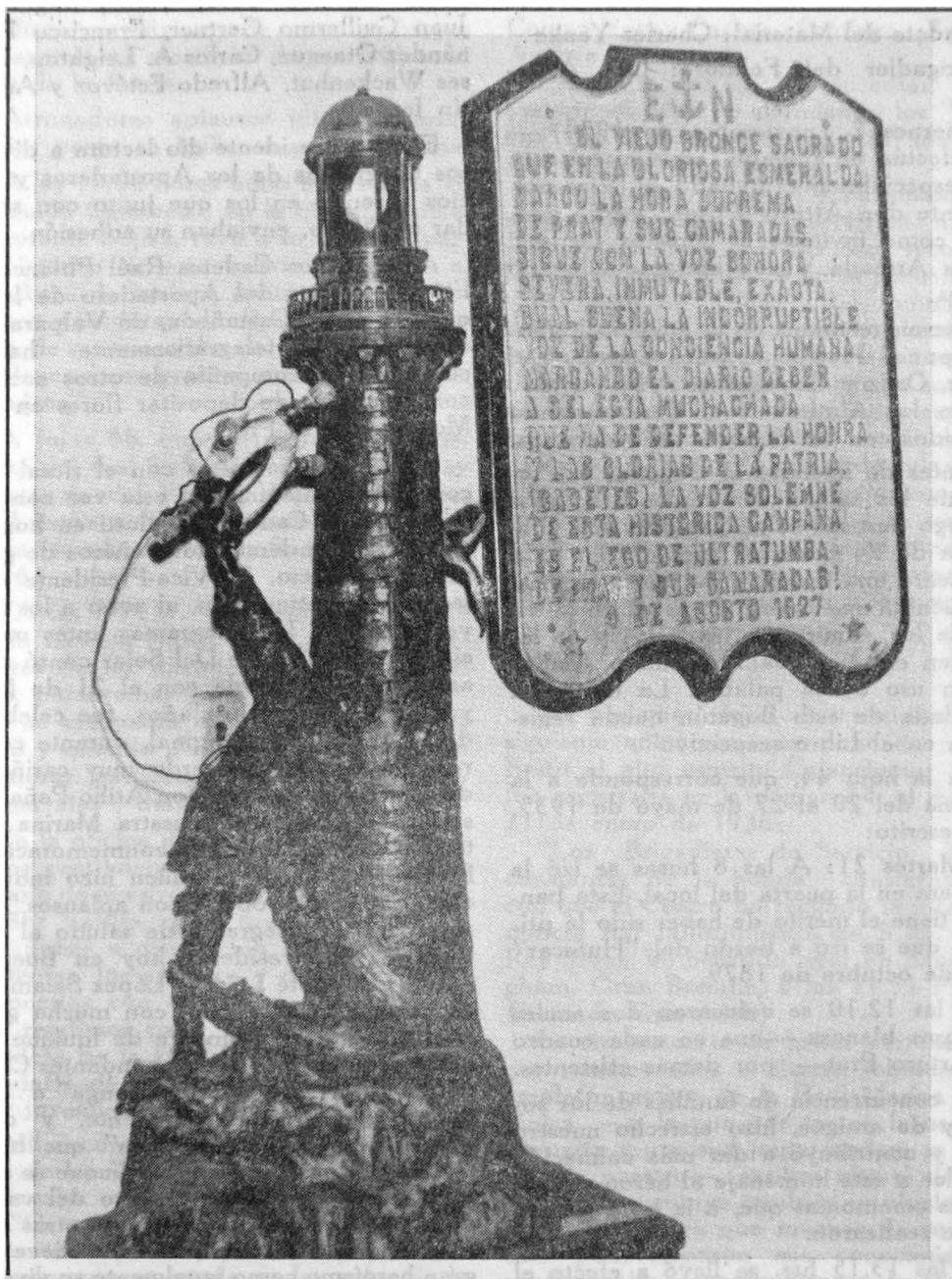
Reproducción de la placa existente en la Escuela Naval, junto a la campana de la "Esmeralda" de Prat que se conserva en el "Caleuche" en Santiago.