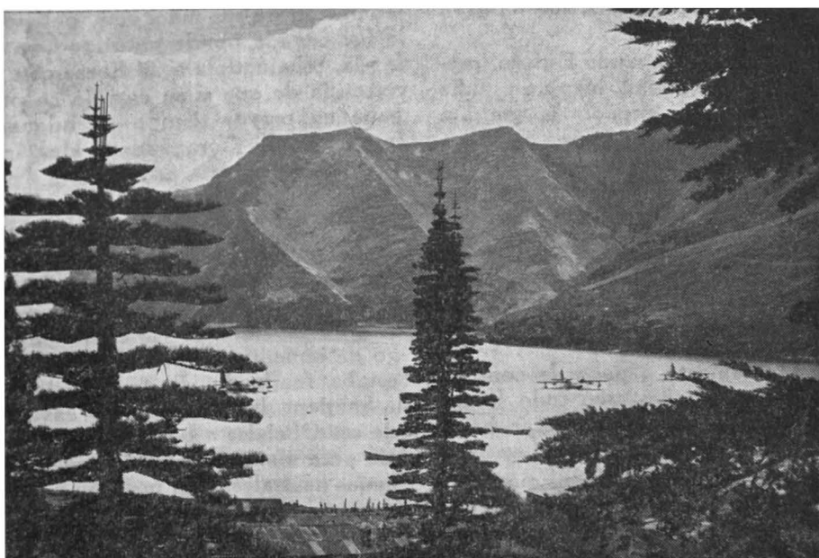
También se posan hidroaviones en las aguas donde otrora llegaban piratas y filibusteros en busca de reposo.

De regreso a su Patria, Selkirk se reintegró a la vida civilizada al parecer con alguna dificultad, pues en varias ocasiones se manifestó arrepentido de haber abandonado su querida isla, lo que no le impidió casarse, enviudar y volver a casarse. Sin embargo murió relativamente