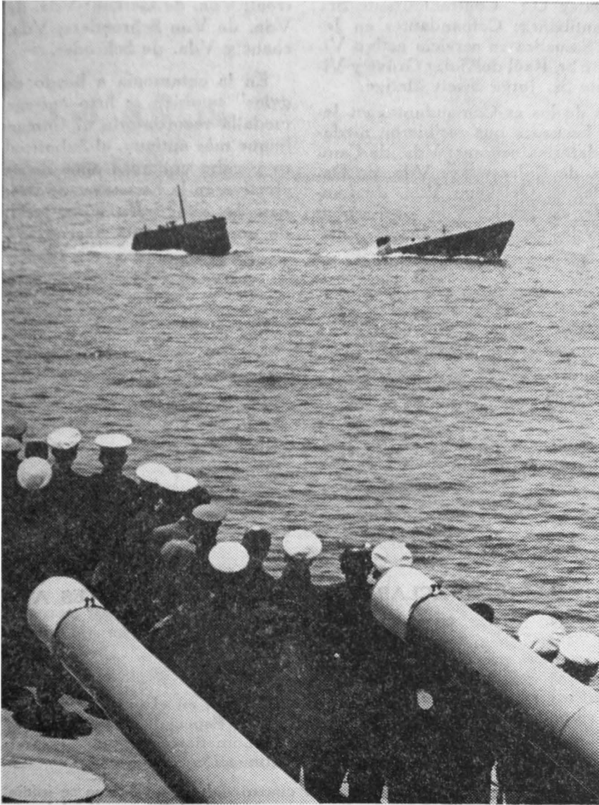
Durante los ejercicios realizados en Valparaíso, en conmemoración del zarpe de la Primera Escuadra Nacional, el submarino "Thomson" aflora frente al buque insignia crucero "Capitán Prat".