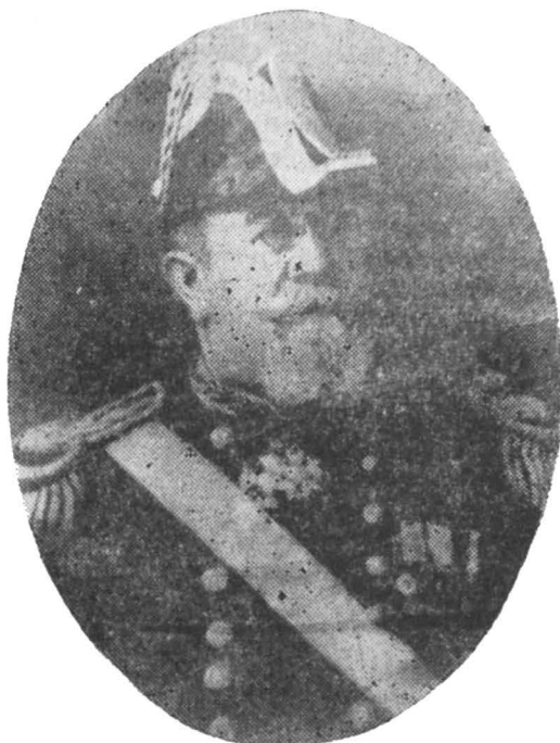
Francisco Nef Jara

A fines de 1896 ascendió a Capitán de Fragata y a principios de 1898 volvió al sur para hacerse cargo de la cañonera "Magallanes", en la cual permaneció cerca de un año en trabajos hidrográficos en la región patagónica.