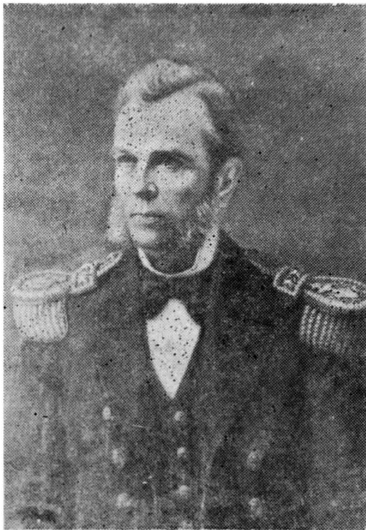
José Anacleto Goffi

Continuó en importantes misiones al mando de la fragata "Chile" y bergantín "Meteor". Participó activamente en la revolución de 1859, secundando hábilmente, al mando de varios buques, los planes del Gobierno, contribuyendo con ello a la derrota que sufrieron los revolucionarios en Cerro Grande.