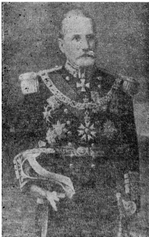
Jorge Montt Alvarez

Desde 1858 hasta 1913, años en que perteneció a la Armada, desempeñó numerosas comisiones como oficial, Comandante de buques y Almirante, destacándose siempre como un gran marino, severo, honrado, patriota y capaz. El año 1860 formó parte de la dotación del famoso bergantín "Meteoro". Participó en la guerra contra España (1865-1866) y se encontró en los combates de Papudo y Abtao. En 1877 fue Comandante de la corbeta "Esmeralda" con la que hizo un viaje de instrucción a la isla de Pascua y Tahiti. Durante la guerra del 79, al mando de la "O'Higgins", le cupo un desempeño activo y eficiente. Se encontró en las siguien-