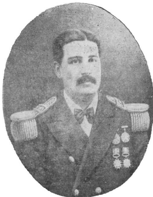
Juan José Latorre Benavente

Desde 1866 a 1879, Latorre prestó importantes servicios al país, especialmente en trabajos hidrográficos. La guerra del Pacífico lo encontró precisamente destacado en la zona austral al mando de la "Magallanes". Se batió en Chipana distinguiéndose y luego en la noche del 10 de junio de 1879, en Iquique, trabó combate con el monitor "Huáscar", que en tres ocasiones embistió a la "Magallanes" para hundirla con un espolón; pero Latorre, demostrando una extraordinaria habilidad de maniobra, eludió con facilidad el ariete, defendiéndose enérgicamente a cañonazos.