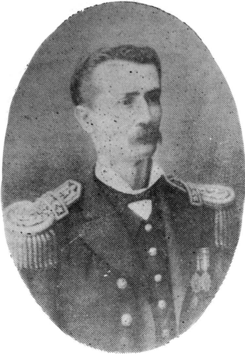
Galvarino Riveros Cárdenas

En enero de 1880 expedicionó hasta Huacho y Chinchas, destruyendo elementos del enemigo. Mandó el convoy que condujo al Ejército Expedicionario sobre Tacna y Arica y tomó parte en el bombardeo de Arica; dirigió las campañas marítimas sobre Mollendo y estableció el bloqueo de El Callao. En noviembre y diciembre cooperó en Arica al embarque del Ejército Expedicionario sobre Lima, desembarcándolo en Curayaco y por último, cooperó con sus fuerzas navales en la protección de las tropas que dieron las batallas decisivas de Chorrillos y Miraflores.