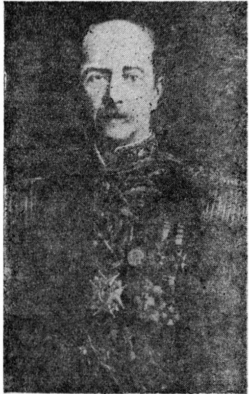
Patricio Lynch Zaldívar

Lynch resultó herido en esa jornada y por su comportamiento mereció el ascenso a Capitán de Fragata en 1852.