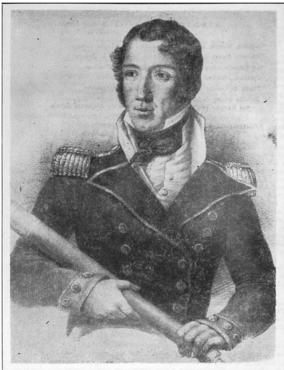
Almirante Lord Thomas A. Cochrane