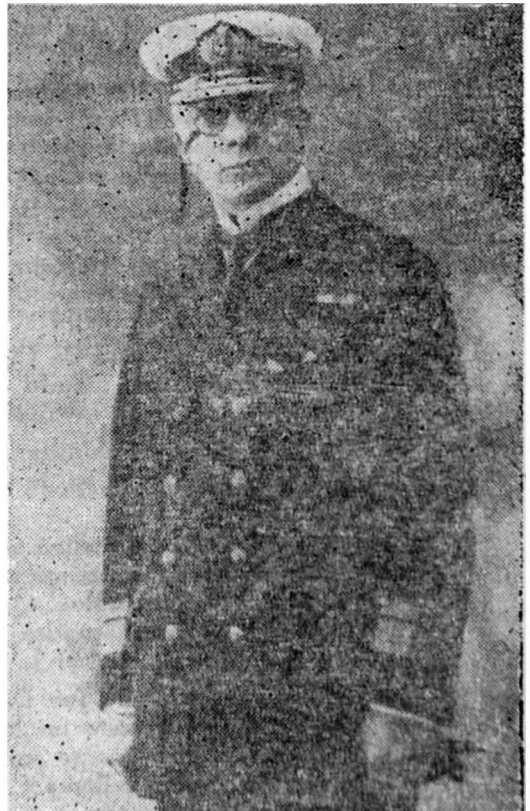
Luis Gómez Carreño

El Almirante Gómez Carreño fue una de las figuras más descollantes del primer tercio del presente siglo en la Marina. La notable personalidad del Almirante Gómez, su entrañable amor a la Institución, su temple moral,