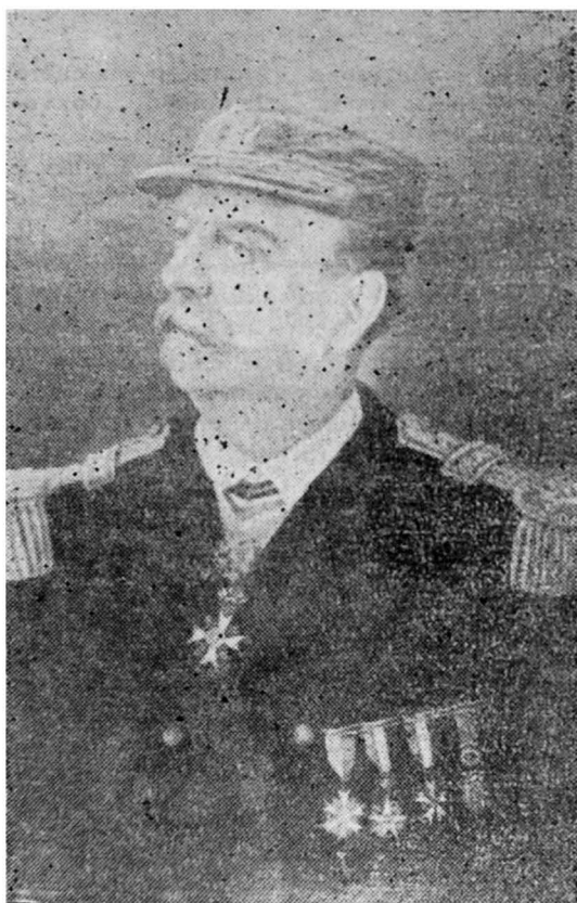
Oscar Viel y Toro

La guerra de 1879 lo sorprendió al mando de la corbeta "Chacabuco", en la que secundó los planes de la Superioridad, tanto en convoyes de transportes con tropas, como en los bloqueos de Iquique, Arica, Picocha,