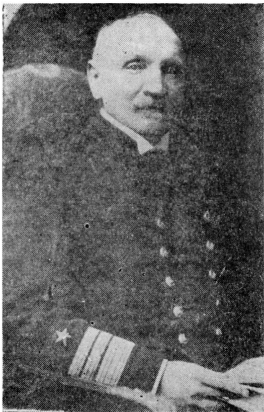
Lindor Pérez Gacitúa

En enero de 1874 recibió sus despachos de Guardiamarina y ese mismo año se embarcó en la corbeta "O'Higgins" y luego en la "Magallanes" permaneciendo de estación en el Estrecho de Magallanes durante el año